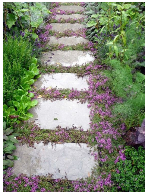
Figure 2 Thym rampant entre des dalles.

vivaces, avec une densité moyenne de 4 à 6 plantes au m 2 .