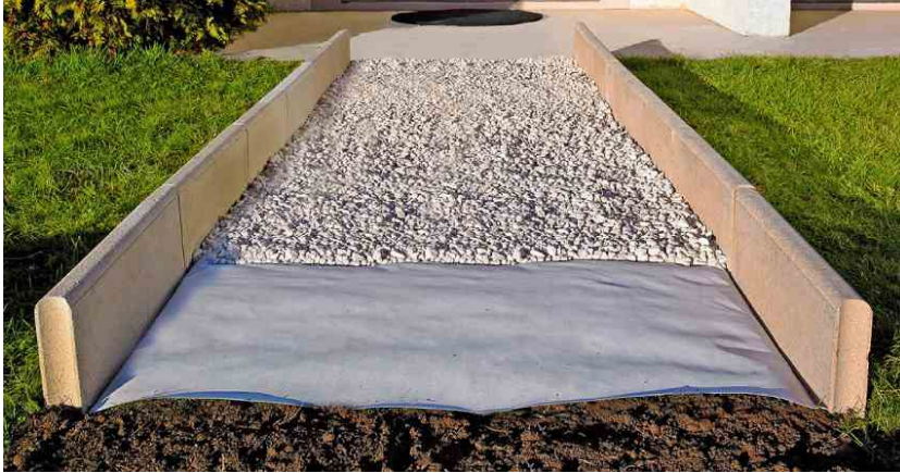
Figure 3 Pose d'un feutre géotextile recouvert de gravier avec bordures délimitant le gazon.

peu poussantes, qui résistent au piétinement, est à privilégier. D'autres solutions sont possibles comme l'utilisation de géotextile (feutre perméable) recouvert de gravier et entouré de bordures. Le géotextile permet de limiter les adventices venants du sol tandis que les bordures limitent celles venant du gazon ou des massifs adjacents.