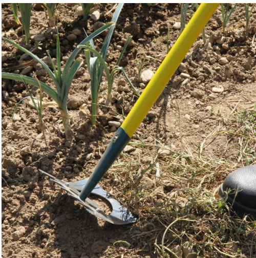
Figure 4 Binette pour désherber les allées du potager.

Enfin, pour l'entretien il est primordial de bien s'équiper. De nombreux outils ont été adaptés à chaque type d'usage. En effet, des houes de désherbage, des ratissoires et des binettes ergonomiques ont été développées pour des usages dans les massifs, sur sables et graviers. Plusieurs améliorations ont permis d'avoir des outils plus légers, optimisant la posture et permettant de fournir moins d'efforts physiques.