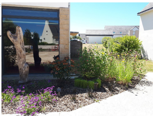
devant la mairie

faciliter l'entretien des massifs avec ou sans paillage :